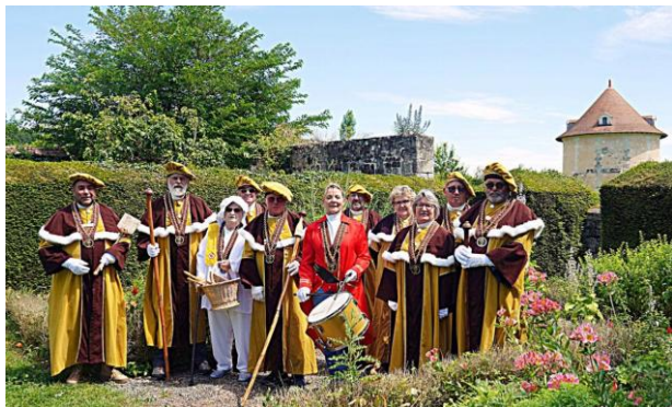
La Confrérie de la Fouace Rabelaisienne à l'abbaye de Seuilly

Nom, Prénom, adresse, profession, violon d'ingres, goûts ainsi que quelques anecdotes amusantes.